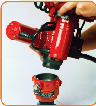
2" 快插接头车前炮理想装